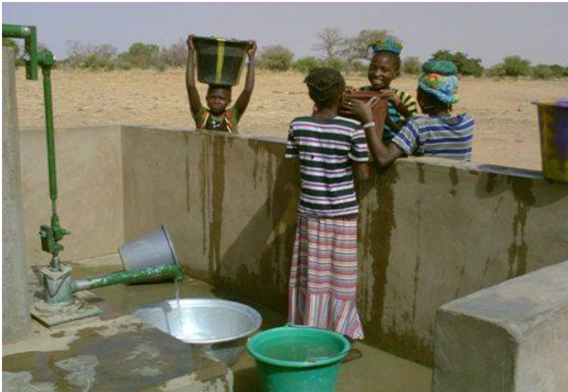
Pozo de agua. Bomba manual volanta en poblado rural de Bonsiega/Nassabdou–Burkina Faso–