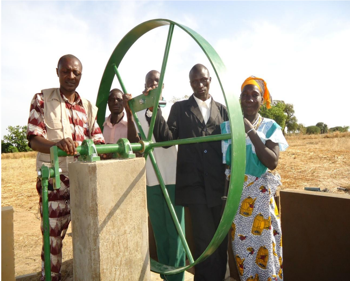
Entrega del pozo de agua al comité de gestión de Samou, con Adama-Burkina Faso-.