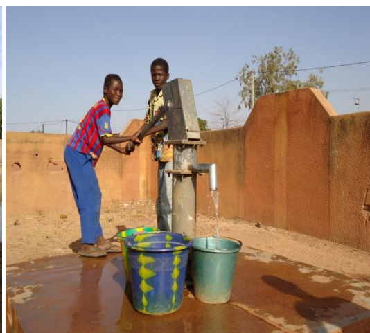
Agua potable escuela Faso Baara