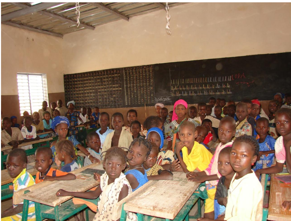
Niños en el aula de la Escuela Dinguila Peulh–Burkina Faso–