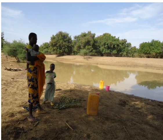
El agua "no potable" suministro habitual