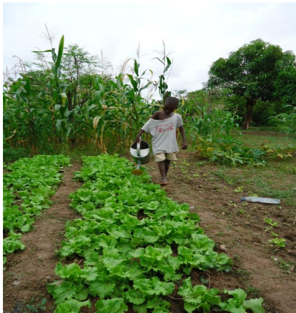
Regando huerta del “Hôtel Maternell” Ouagadougou–Burkina Faso–