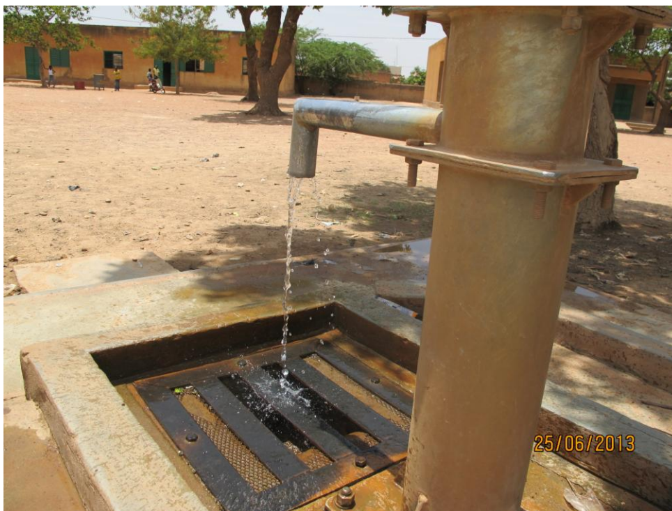
Mantenimiento bomba manual en escuela de Ouagadougou–Burkina Faso–

3.5 PROYECTO EN BURKINA FASO : Perforación de un pozo de gran profundidad e instalación de bomba manual Volanta para la obtención de agua potable, mantenimiento, formación y sensibilización en Samou.